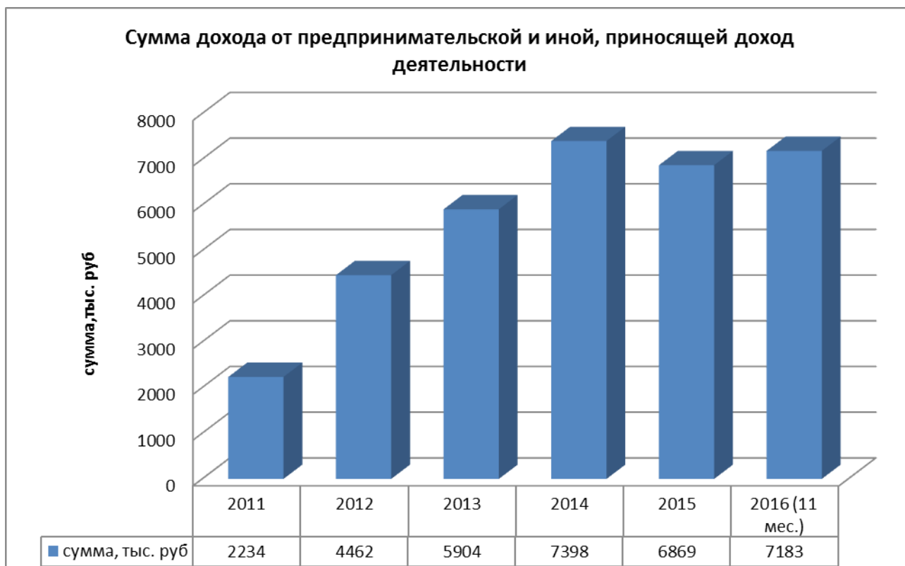
График 1. Доход от предпринимательской и иной, приносящей доход деятельности ГАУСО НСО НОГЦ за период с 2011 по 2016 год (01.12.2016 г.)